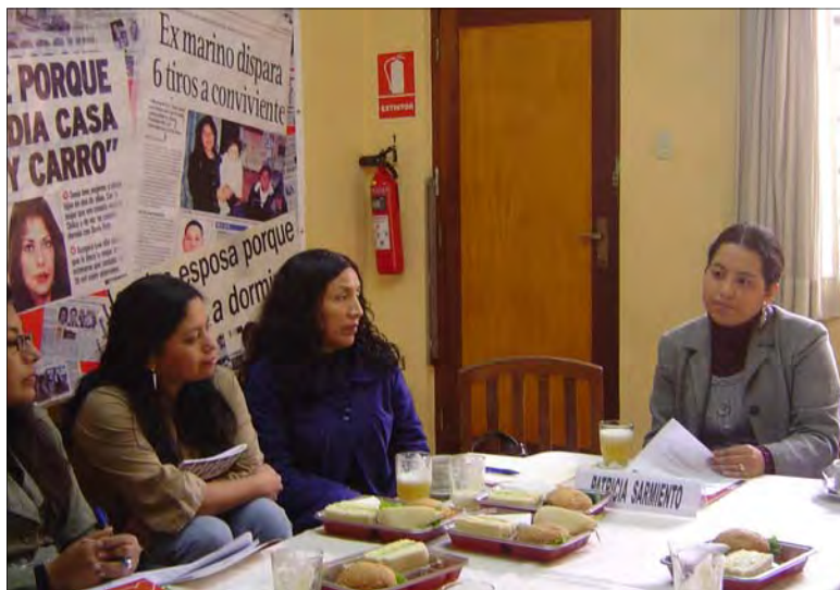
Participantes en el encuentro en Lima-LyT