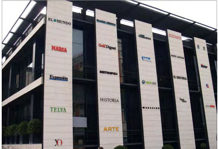
Sede del grupo Unidad Editorial en Madrid

Después, ya en septiembre, se firmó el convenio de Unidad Editorial , empresa a la que pertenecen todas las personas del citado grupo que no forman parte de las redacciones, más el departamento de Documenta-