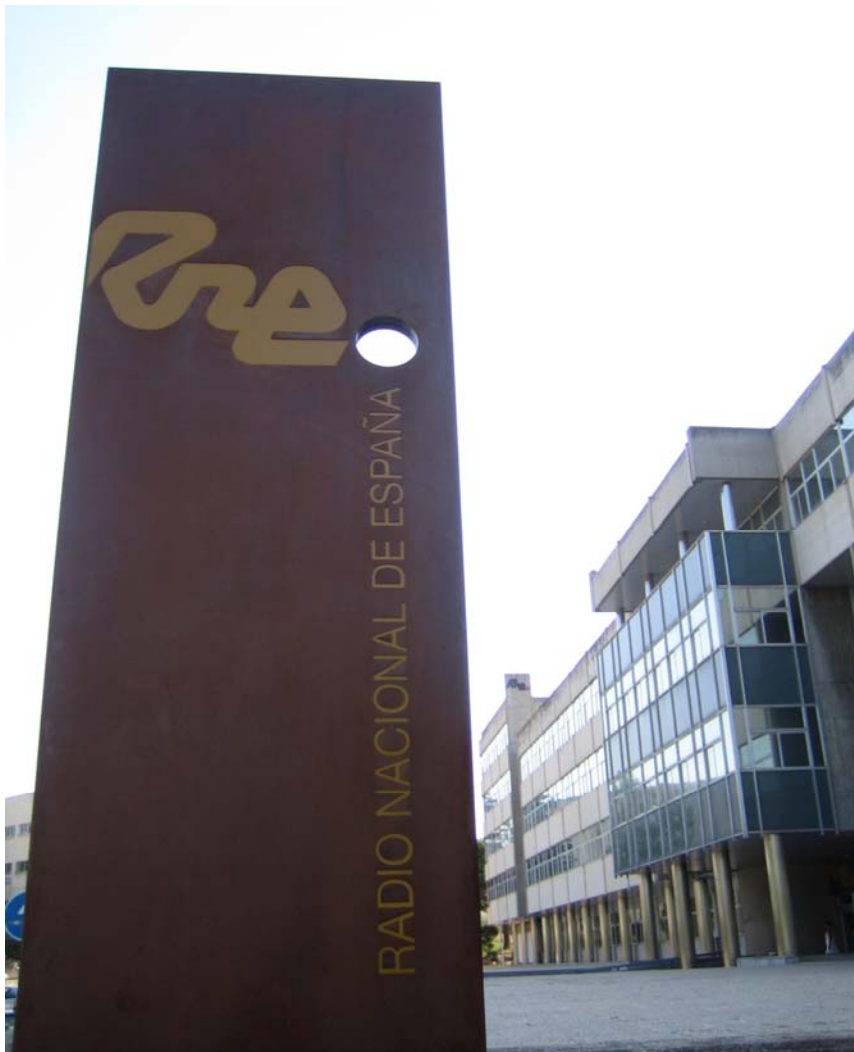
Fachada delantera del edificio de Radio Nacional de España en Madrid