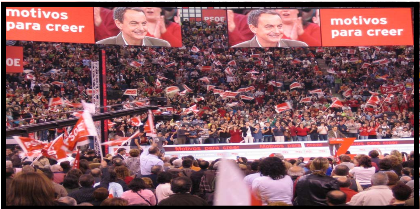
Mitin de Zapatero en Madrid en plena campaña electoral.