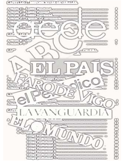
Ilustración: Antonio Peiró