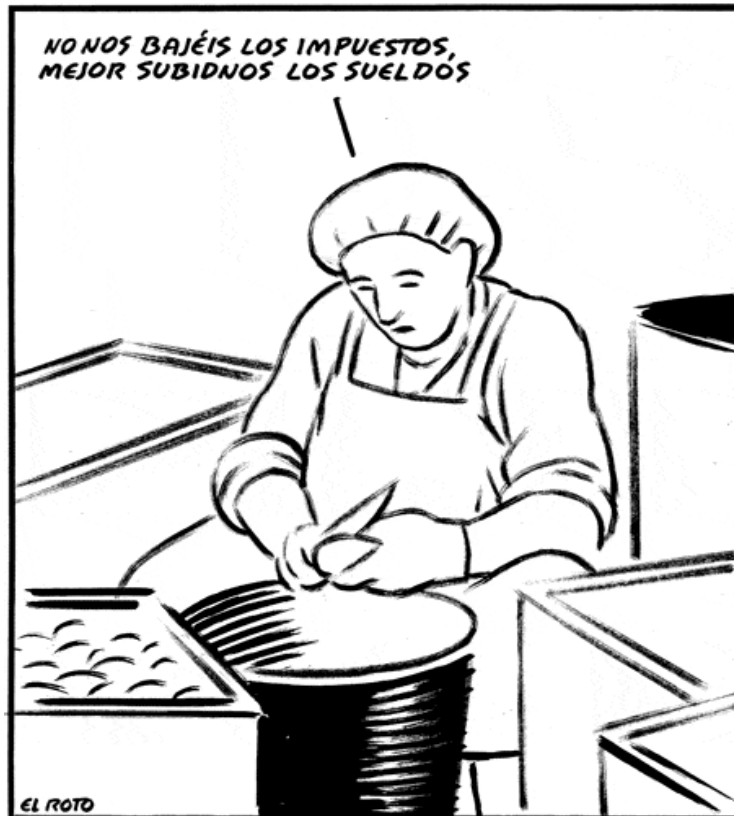
Viñeta de El Roto en El País 21-2-08

La limpia de nuestros bolsillos es apabullante. Desde luego, los de miles de trabajadores públicos y funcionarios