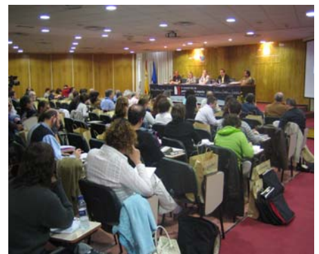
Una de las sesiones de la V Convención

La literalidad de la resolución adoptada por la convención expresa claramente la necesidad de que RSF vuelva atrás sobre sus burdas descalificaciones